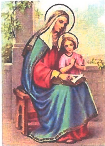
SAINTE ANNE Priez pour nous