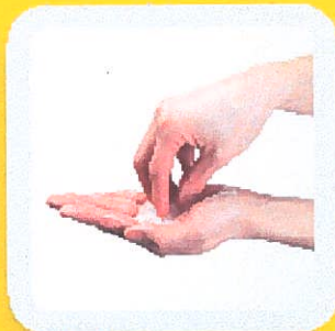
4 NETTOYER LES ONGLES