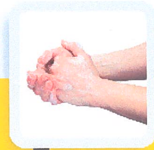
3 FROTTER DE 15 À 20 SECONDES