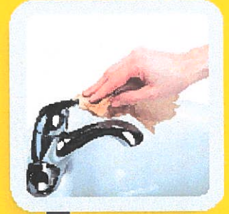
7 FERMER AVEC LE PAPIER